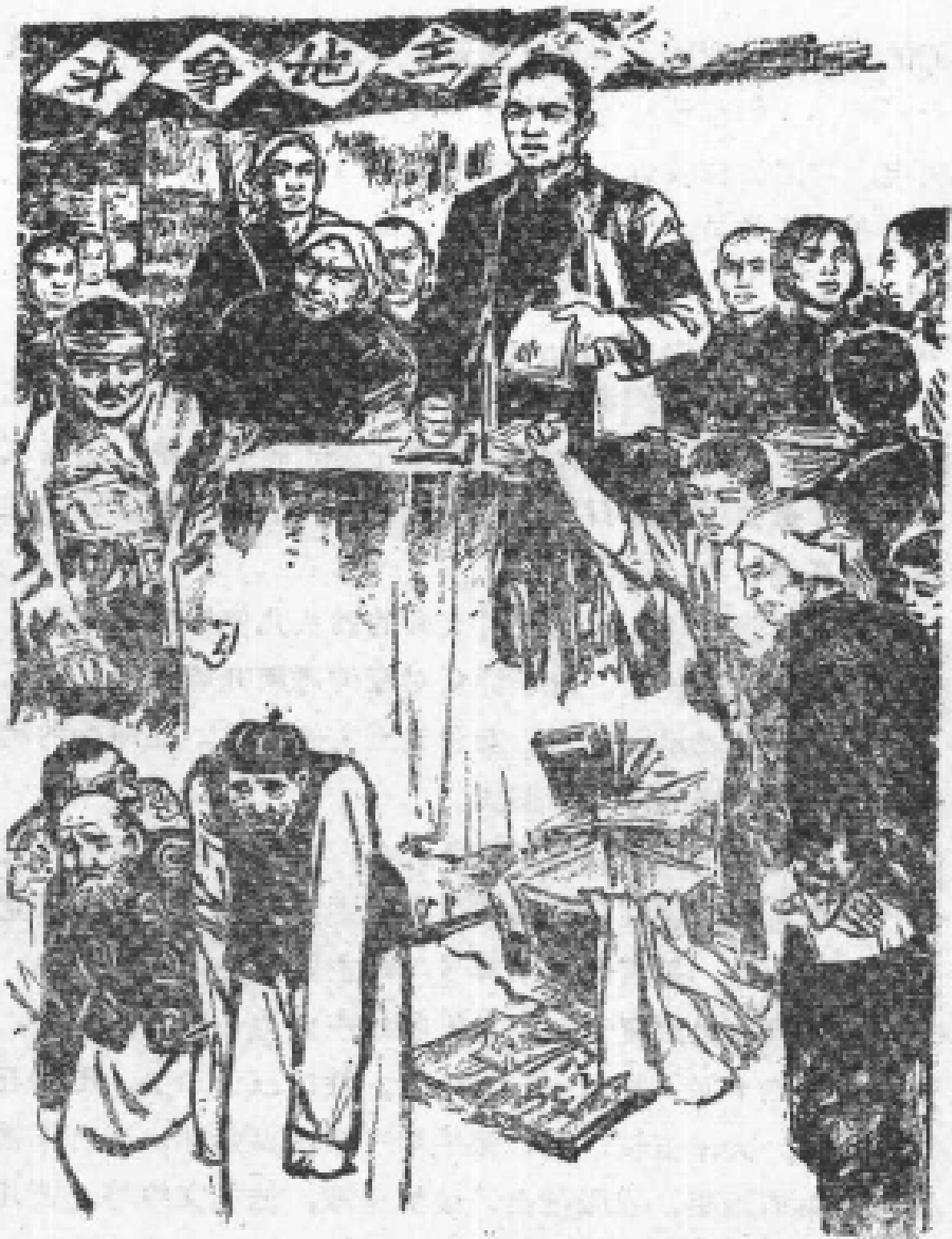
贫协代表孝科妮戴着红袖章站在讲台上主持大会。